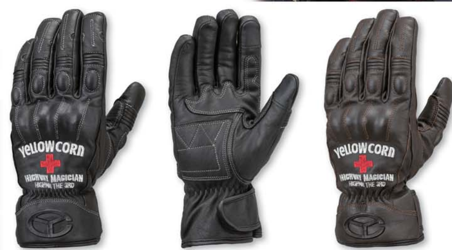
BLACK YG-284W Leather Gloves PRICE : ¥9,800+tax COLOR : BLACK. DARKBROWN SIZE : M. L. LL