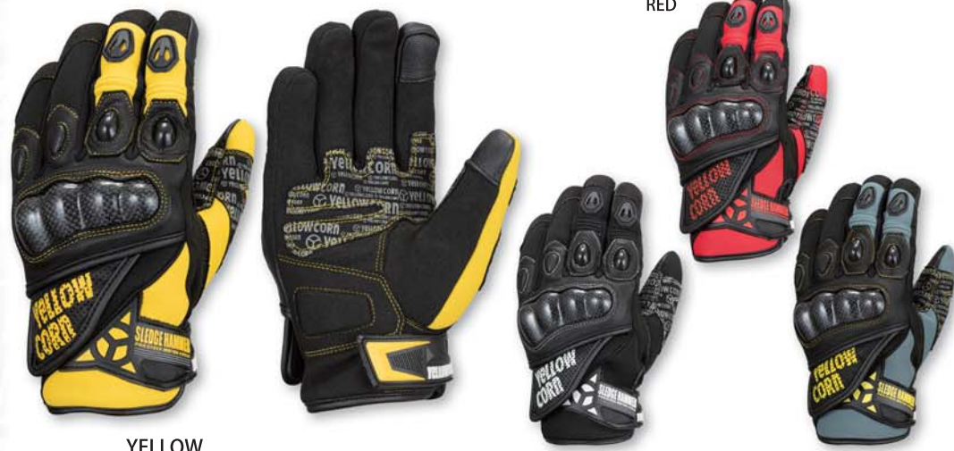
YELLOW YG-292W Neoprene Gloves PRICE : ¥7,600+tax COLOR : BLACK. RED. YELLOW. GRAY SIZE : M. L. LL

甲側：ネオプレン/ゴートレザー/アマール 平側：アマール ・防寒防水 ・スマホ対応