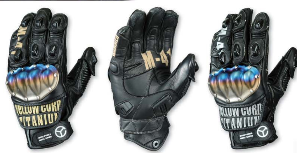
BLACK/GOLD YG-191 Leather Gloves PRICE : ¥14,000+tax COLOR : BLACK/GOLD. BLACK/SILVER SIZE : M. L. LL