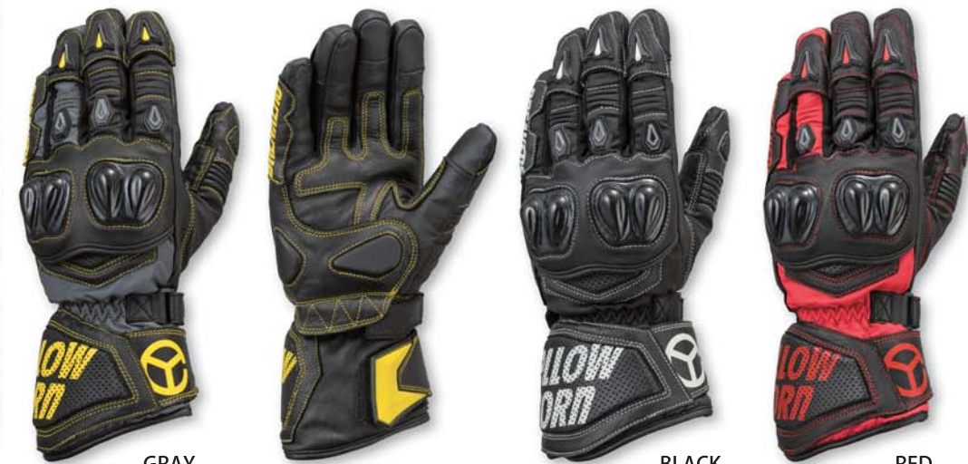
GRAY YG-285W Nylon x Leather Gloves PRICE : ¥11,000+tax COLOR : BLACK. RED. GRAY SIZE : M. L. LL

甲側：ナイロンツイル/ゴートレザー 平側：ゴートレザー ・防寒防水 ・スマホ対応