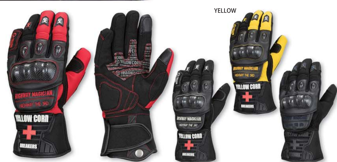
RED YG-293W Neoprene Gloves PRICE : ¥8,800+tax COLOR : BLACK. RED. YELLOW. ALLBLACK SIZE : S. M. L. LL. 3L

甲側：ネオプレン/PUレザー/アマール 平側：アマール/ネオプレン ・防寒防水 ・スマホ対応