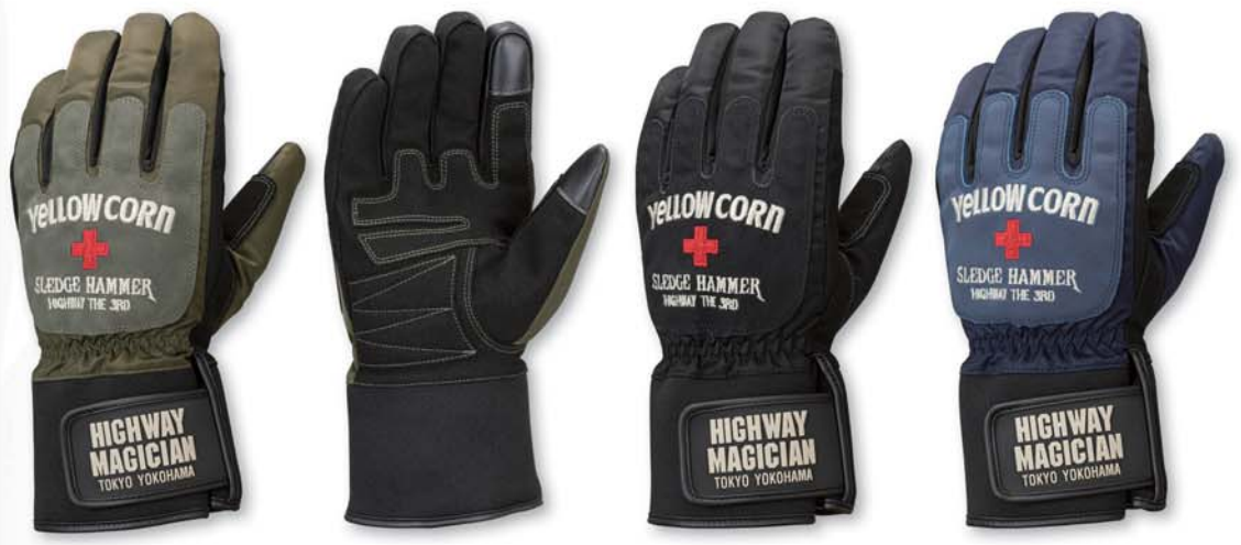
KHAKI BLACK NAVY

YG-290W Nylon Gloves PRICE : ¥6,500+tax COLOR : BLACK. KHAKI. NAVY SIZE : M. L. LL