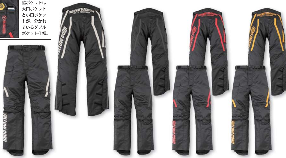
BLACK/IVORY BLACK/GUNMETAL BLACK/RED BLACK/YELLOW

表地：ナイロンツイル/ナイロンオックス/リフレクター 裏地：ナイロン 中綿：ポリエステル ・防寒防水 ・ヒートガード ・リフレクター ・ウエスト調節 ・裾口調節